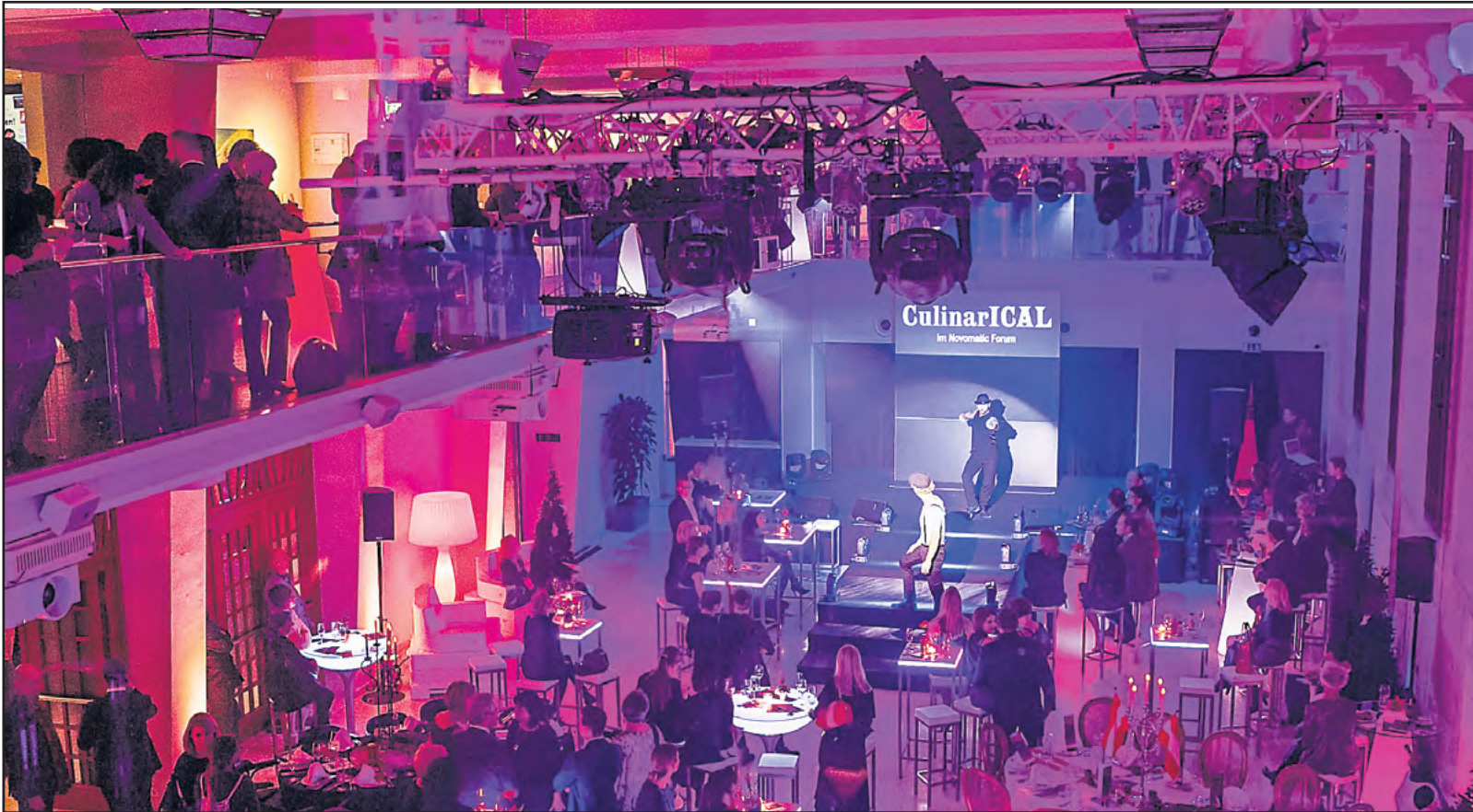
Mit der gelungenen Novomatic Forum Night 4th Edition präsentierte das professionelle und engagierte Team des Novomatic Forum den Gästen wieder die Vielseitigkeit der Inszenierungsmöglichkeiten der verschiedenen Veranstaltungsräume.

Ob für Großereignisse wie B2B- und B2C-Events, Konferenzen und Kongresse, Galaabende, Tagungen und Seminare - das Novomatic Forum bietet hierfür einen ansprechenden und professionellen Rahmen. Dessen waren sich auch die rund 300 Gäste bei der 4. Novomatic Forum Night, dem jährlichen Kundenevent des Novomatic Forum, bewusst. Zu den Höhepunkten des Abends zählten der Auftritt des R'n'B-Musik-Acts Disco Inferno, die LED-Lightshow von Pyrroterra sowie eine mobile Rennautobahn von Race Event. Dazu begeisterte der Wiener Modedesigner Maurizio Giambria mit einer fulminanten Fashionshow, bestehend aus der aktuellen