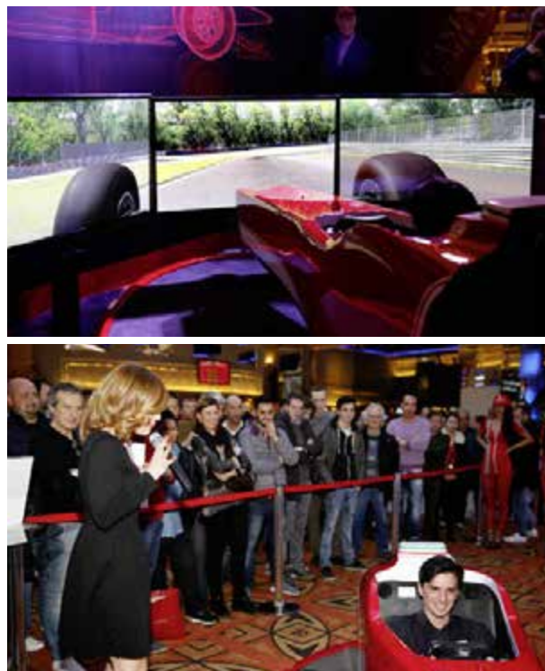
Niki Lauda and the winners of the F1 simulator race.