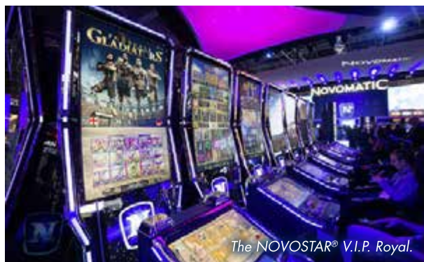
The NOVOSTAR® V.I.P. Royal.