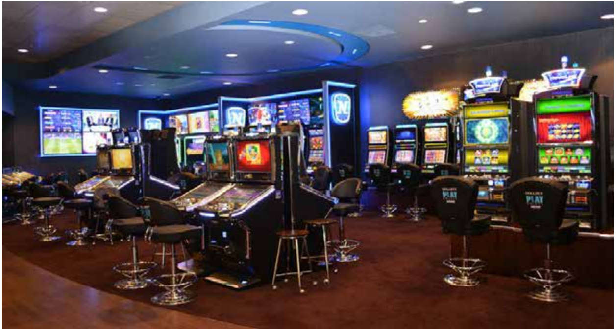
Grosvenor G Casino Luton.