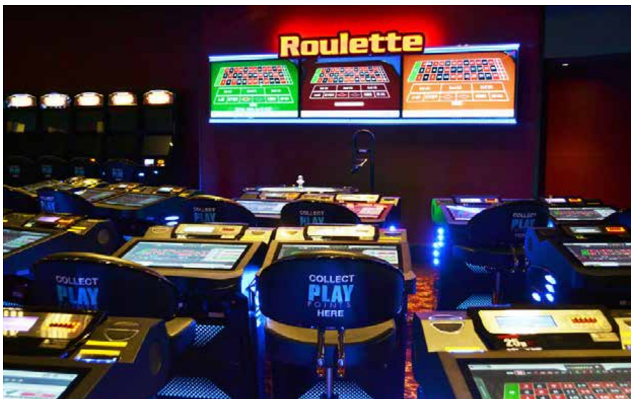
NOVOMATIC electronic live games at G Casino Luton.