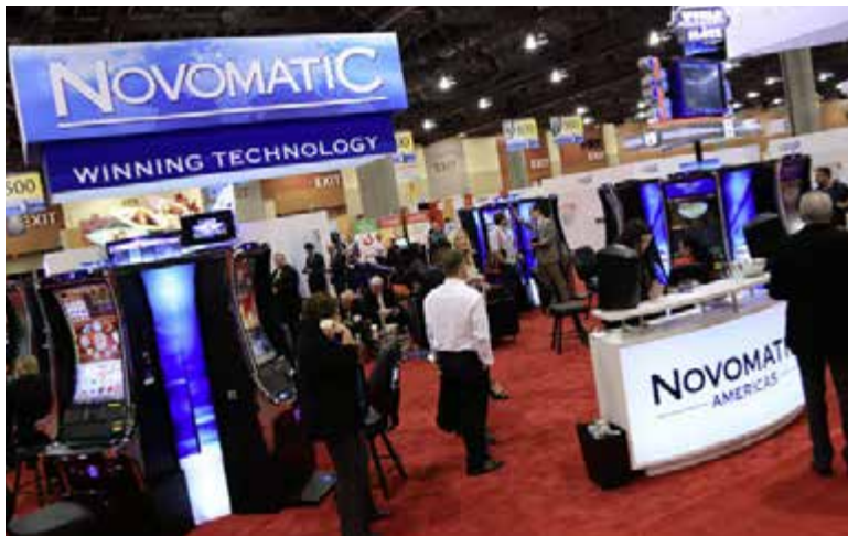
Top: NOVOMATIC Americas booth at NIGA 2016; Center: NOVOMATIC cabinets getting prepped for shipping; Bottom: New NOVOMATIC Americas facilities in Illinois.