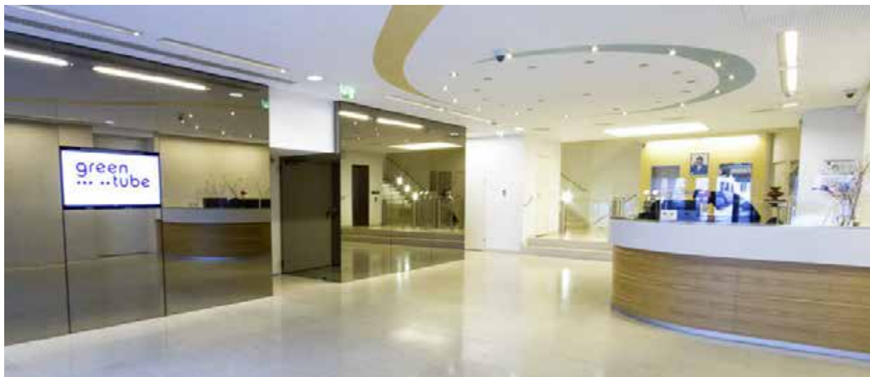
Top to bottom: the reception, the interactive show lounge and the restaurant.

Greentube's new workplace also includes a restaurant and cafeteria in a free-flow area favoring engagement. A number of large terraces on the top floor with panoramic views over Vienna and the Wienerwald are an added delight. ■