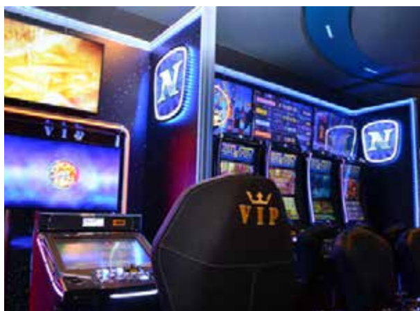
V.I.P. wall installation.