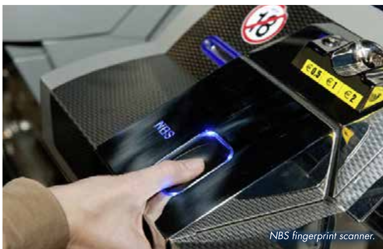
NBS fingerprint scanner.

Die Einführung dieser Technologie in Glücksspielbetrieben ist somit für die Gäste völlig natürlich, besonders für die jüngere Generation, die im Glücksspiel eine Technologie erwartet, die jener in anderen Unterhaltungsangeboten um nichts nachsteht. Die Kunden sind in zunehmendem Maße daran gewöhnt, kein Bargeld bei sich zu tragen und bezahlen bereits bevorzugt auf