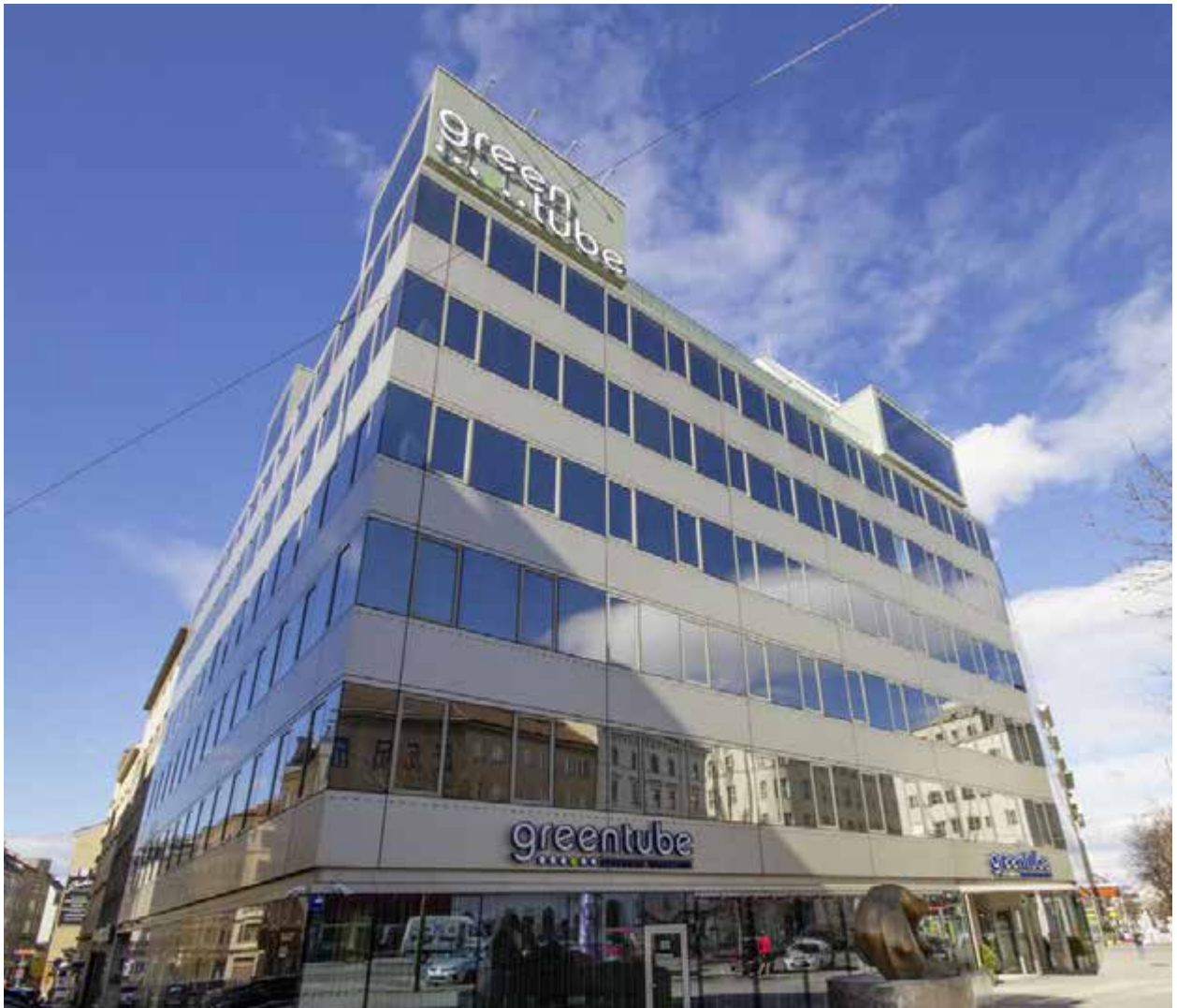
The new Greentube HQ building.

leveraging the advantage of having all employees under one roof to strengthen Greentube's as well as NOVOMATIC Lottery Solutions' workplace culture and enhance the company's success.