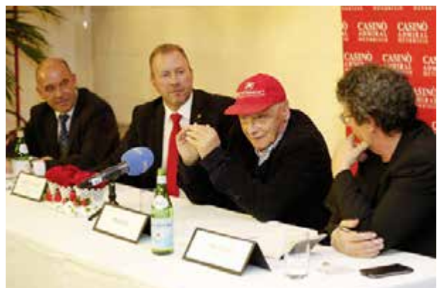
Niki Lauda at the press conference at Casinò ADMIRAL Mendrisio.

Guests of Casinò ADMIRAL Mendrisio had been waiting with great anticipation for the event to take place. On March 5th a real F1 simulator was set up and all casino visitors had the opportunity to race on the Monza circuit and record their best possible lap times during a 5-minute trial. The two fastest racers of each day qualified for the grand finale on March 11, where the 12 top racers met for the final competition.