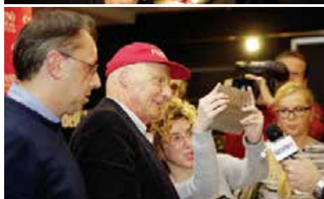
Niki Lauda with fans.

After the festive award ceremony for the three winners of the F1 simulator competition, Niki Lauda handed out signed red caps to casino guests and took his time to sign autographs as well as F1 memorabilia as well as take selfies with fans.