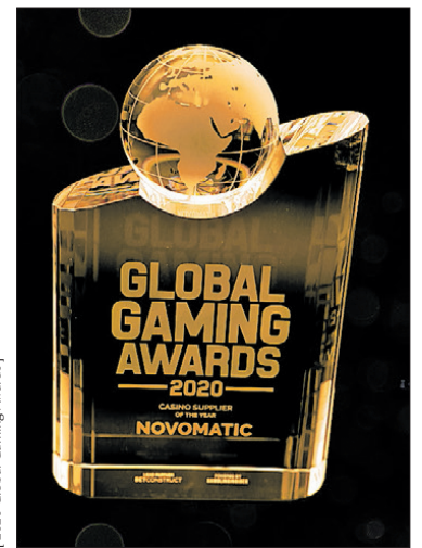
[2020 Global Gaming Awards]